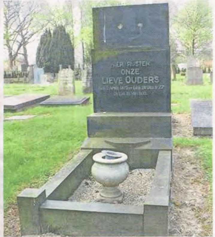
▲ Het graf van de heer en mevrouw Schepers op de Essenhof in Dordrecht.