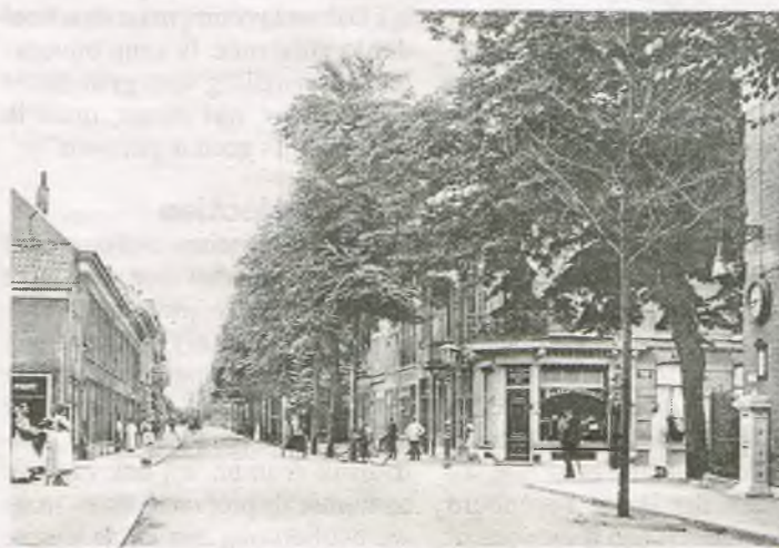
▲ De kruising Spuiweg-Singel met rechts het pand van bakker Schepers. In de verte kwam later de Krispijntunnel.

Op de terugweg naar Dordrecht ging het afschuwelijk mis. Een bizar ongeluk dat later alle landelijke kranten zou halen. De Dordrechtse Courant besteedde er een dag later de hele voorpagina aan. Auto's waren