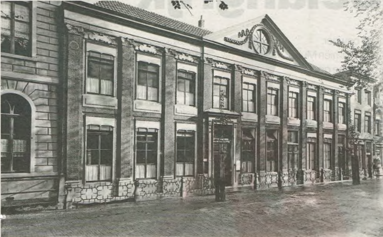
▲ Doelesteyn omstreeks 1925, nog met drie voordeuren. Bij de laatste verbouwing werd de middelste deur weggehaald. Of de hoofdingang altijd op die plek heeft gezeten is onbekend. De deur is uit het midden en lijkt wat erg simpel voor een dergelijk buitensporig groot pand. Het 18de-eeuwse stoephek is voor Dordrecht bijzonder.

Sinterklaas heeft vanaf 21 november zijn domicilie in huis Doelesteyn aan het Steegoversloot. De bouw van het kolossale pand rond 1657 betekende rampspoed en ellende voor de bouwheer.