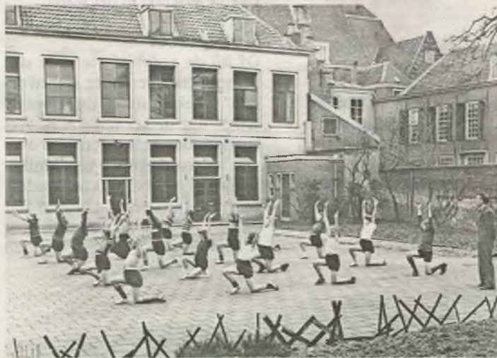
▲ De achterzijde van Doelesteyn in 1947. Gymnastiek voor de leerlingen van de 'Huishoudschool'. Rechts de gebouwen van de rechtbank.